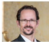
Balthasar Glättli président des VERT-E-S suisses @bglaettli

▲ L'équipe du secrétariat des VERT-E-S suisse analyse les résultats électoraux en direct.